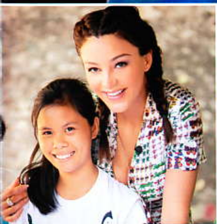
VERONA POOTH über Tränen, Wut & Angst S. 38-41